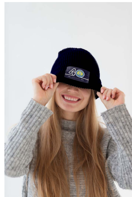
Muts € 12,50