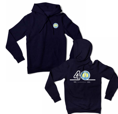
Hoody (zonder rits) jubileum logo alleen op voorzijde gedrukt € 35,-