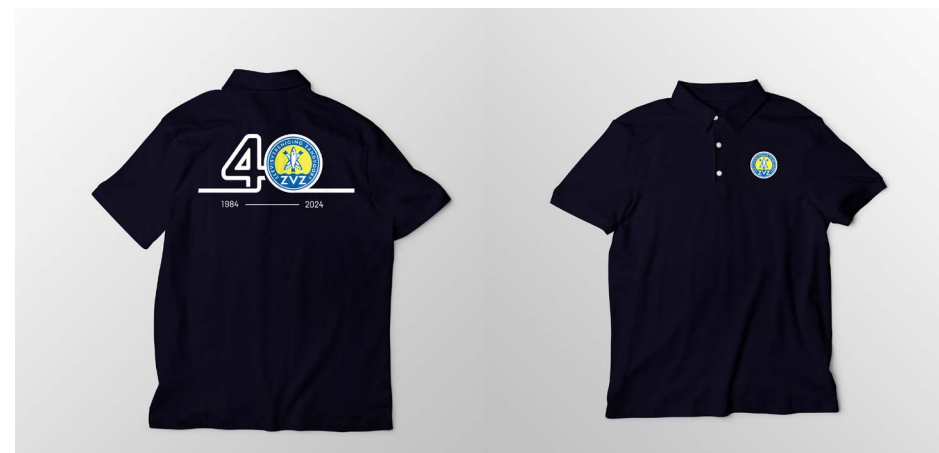
Polo € 29,95